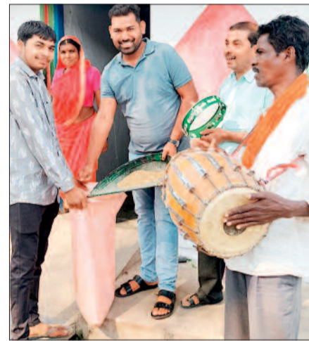
महासमुंद। लाफिनखुर्द में मनाया गया छेरछेरा पर्व।

जिला मुख्यालय के नजदीकी ग्राम खैरा में छत्तीसगढ़ का पारंपरिक छेरछेरा पर्व हर्षोल्लास के साथ मनाया गया। छेरछेरा, कोटी के धान ल हेरहेरा के जयघोष के साथ पूरा गांव उत्सव के रंग में डूबा नजर आया। सुबह से ही बच्चों की टोलियां हाथों में थैले और टोकरियां लेकर घर-घर पहुंचने लगे। बच्चों के साथ-साथ युवाओं और बुजुर्गों में भी इस पर्व को लेकर खासा उत्साह देखा गया। ग्रामीणों ने अपनी परंपरा का निर्वहन करते हुए अन्न दान एवं चावल अपने सामर्थ्य अनुसार दान दिया। मान्यता है कि इस दिन दान देने से घर में सुख-समृद्धि आती है और भंडार भरते रहते हैं। गांव की गलियों में डफली और मांदर की थाप पर लोक गीतों की गुंज सुनाई दी। खैरा में यह पर्व आपसी भाईचारे और सामाजिक समरसता के प्रतीक के रूप में मनाया गया। फसल कटाई के बाद खुशी मनाने का यह पारंपरिक तरीका आज भी नई पीढ़ी को अपनी जड़ों से जोड़े हुए है। शाम तक गांव के प्रत्येक घर में उत्सव जैसा माहौल बना रहा।